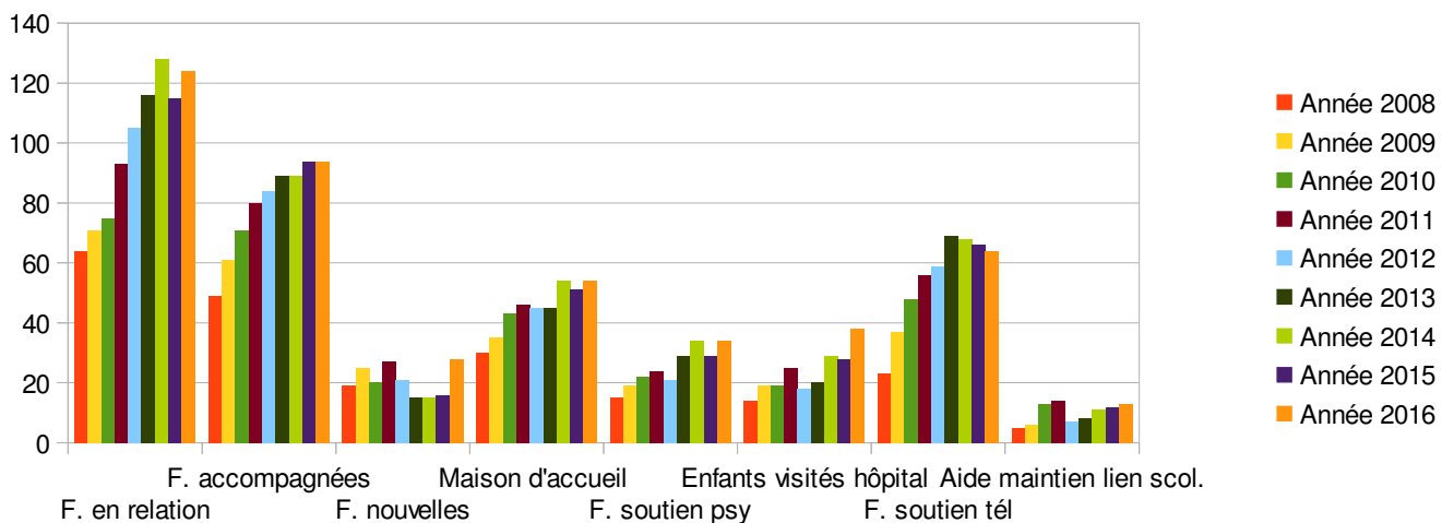
Evolution de l'activité de Source Vive – 2008-2016